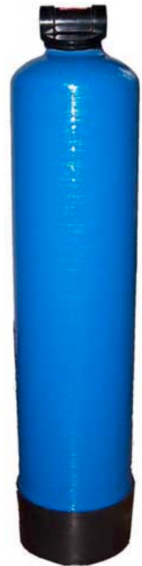
AF-AC 2L säiliö on valmistettu kestävästä komposiittimateriaalista

Voimme tarvittaessa myös asentaa laitteen tuntuksena!