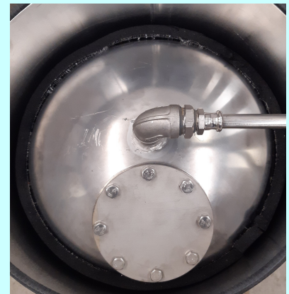
Yläluukusta on helppo lisätä suodatusaineita

Suodatinsäiliö ruostumatonta terästä – lämpöeristys säilyttää veden raikkaan viileänä !