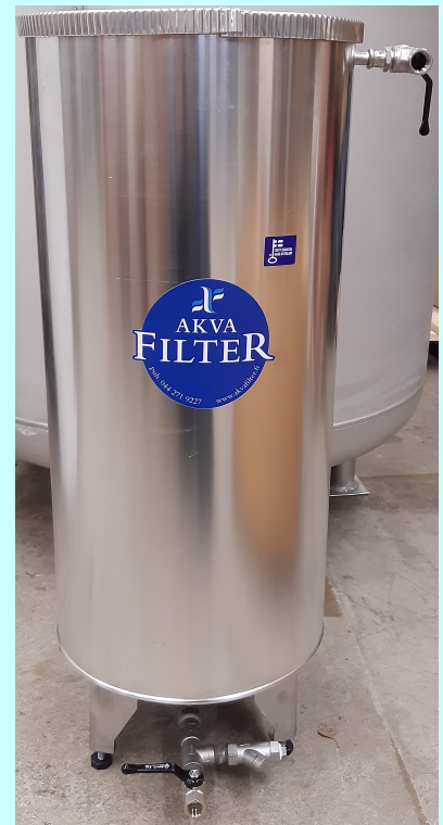
Suodatin on vuorattu tyylikkäästi alumiinilevyllä, jonka sisällä on 13 mm solukumieriste